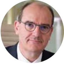
Jean Castex, Premier Ministre

Avec le plan « Avenir Montagnes », l'État porte une ambition forte : construire un modèle touristique à la fois plus diversifié et plus durable pour les territoires de montagne, en lien étroit avec ses principaux acteurs, dont les collectivités territoriales, et ce, tout au long de l'année.