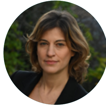
Juliette MEADEL, Ministre déléguée chargée de la Ville

Nous devons relever ce défi avec lucidité, mais surtout avec détermination. Parce que derrière chaque quartier, il y a des vies, des parcours, des potentiels.