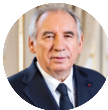
François BAYROU, Premier ministre

Le Gouvernement s'est donné pour mission de renouer avec une politique cruciale dans le projet de réconciliation et de refondation qu'il porte : l'aménagement harmonieux du territoire.