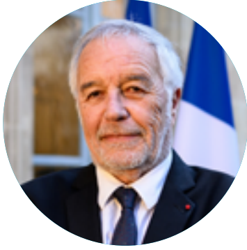
François REBSAMEN, Ministre de l'Aménagement du territoire et de la décentralisation

L'aménagement du territoire n'est pas une affaire de plans, de cartes ou de normes. C'est une vision profondément humaine et républicaine : celle d'un pays où chaque territoire compte, où chaque habitant, où qu'il vive, doit avoir accès aux mêmes chances, aux mêmes droits, aux mêmes espoirs.