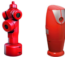
Poteau incendie à plusieurs accès