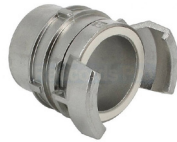
Raccord Guillemain aussi appelé « pompiers »