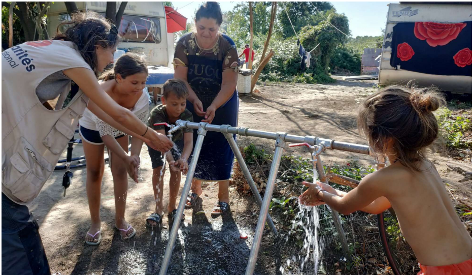
Rampe d'accès à l'eau sur un site à Toulouse, 2023

moyenne, cf. question 18). Si ces solutions sont inexistantes ou techniquement infaisables, le raccordement sur bornes ou poteaux incendie avec l'accord de l'autorité responsable de la gestion de défense extérieure contre incendie est possible. (cf. question 15).