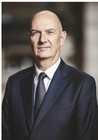
Roland Lescure ministre délégué chargé de l'industrie

Dans l'industrie, on crée, on invente et on innove. « Fabrique ton avenir avec l'industrie », c'est le slogan de l'édition 2023. Et c'est le mien. J'ai la certitude qu'aujourd'hui on fabrique son avenir avec, dans l'industrie.