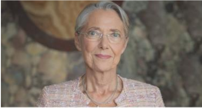
Élisabeth Borne, Première ministre