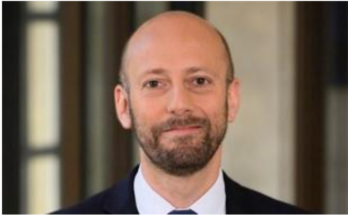
Stanislas Guerini, Ministre de la Transformation et de la Fonction publiques