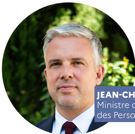
JEAN-CHRISTOPHE COMBE Ministre des Solidarités, de l'Autonomie et des Personnes handicapées

Cette méthode est exigeante, mais nous tenons à réaffirmer avec force qu'elle est la seule qui puisse être à la hauteur des attentes des personnes en situation de handicap.