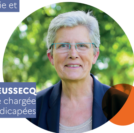
GENEVIÈVE DARRIEUSSECQ Ministre déléguée chargée des Personnes handicapées