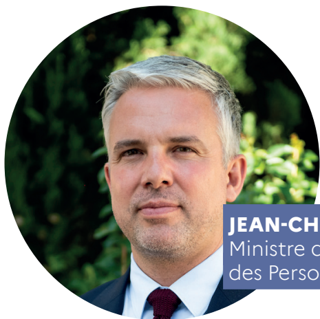
JEAN-CHRISTOPHE COMBE Ministre des Solidarités, de l'Autonomie et des Personnes handicapées

Cette méthode est exigeante, mais nous tenons à réaffirmer avec force qu'elle est la seule qui puisse être à la hauteur des attentes des personnes en situation de handicap.