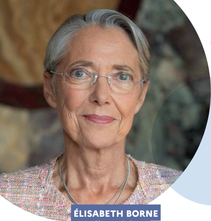
ÉLISABETH BORNE Première ministre

12 millions de Français sont touchés par le handicap. C'est un conjoint, un parent, un enfant, un proche. Ce sont des millions de familles, surtout.